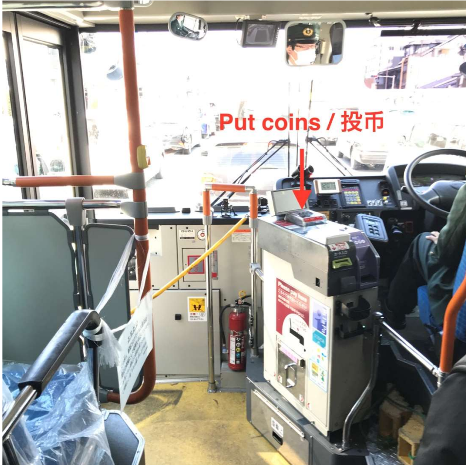
Put coins / 投币