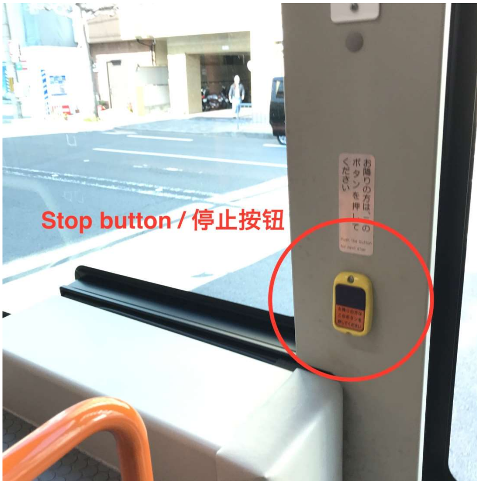
Stop button / 停止按钮